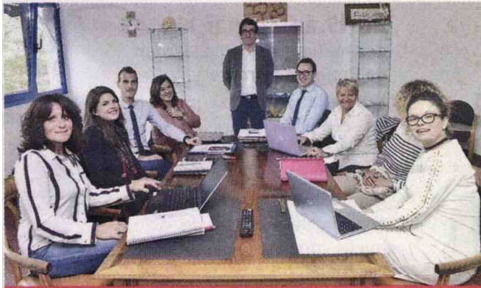
Une équipe (en l'occurrence commerciale) jeune, dynamique, motivée...