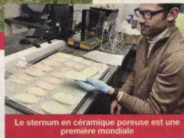
Le sternum en céramique poreuse est une première mondiale

à commande numérique, des centres de fraisage « 5 axes palettisés » et une rectifieuse couplée à un centre de tournage. Afin de travailler des minéraux aussi durs que le diamant, la medtech limougeaude a misé sur l'acquisition d'un premier centre d'usinage par ultrasons. Cette technique est la seule au monde capable d'usiner une céramique poreuse. Les équipes d'I.Ceram recourent à cette technologie ultrasonique pour fabriquer les formes finales des implants directement dans des blocs de céramique frittée. Ces investissements ouvrent la voie à la production d'implants osseux volumineux jusqu'à 1.000 cm 3 . Bientôt omoplates, tibias, et fémurs pourront être remplacés par des implants en biocéramique. De plus, dans trois ans, le nouveau siège d'I.Ceram sera opérationnel. Plus qu'un agrandissement de locaux, c'est une révolution numérique qui accompagnera cette modernisation. Plus d'espace, moins de temps perdu et des acteurs connectés en permanence, l'usine du futur a vocation à valoriser le travail de chacun et favoriser son bien-être.