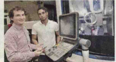
Afin de travailler des minéraux aussi durs que le diamant, l'entreprise a misé sur l'acquisition d'un premier centre d'usinage par ultrasons (en photo la MG ultrasonique)